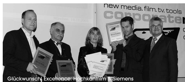
Glückwunsch! Excellence: Hochkanfilm & Siemens