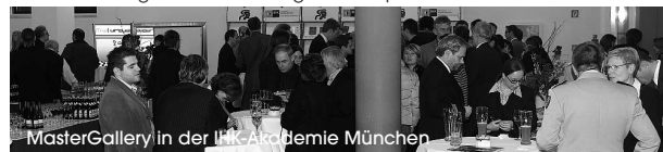
MasterGallery in der IHK Akademie München

Wieder sind es die Automobilen, gefolgt von einigen Finanzdienstleistern, Markenartiklern und der Bundeskanzlerin, die als erste neue Corporate Media-Anwendungen im Internet, aber auch zunehmend auf Flash-Speichern in Form von kleinen portablen Video- oder Daten-Paketen anbieten. Ab sofort bewertet Corporate Media diese Podcast-Lösungen, die auf CD-Trägern oder beliebigen Flashspeichern einzureichen sind.